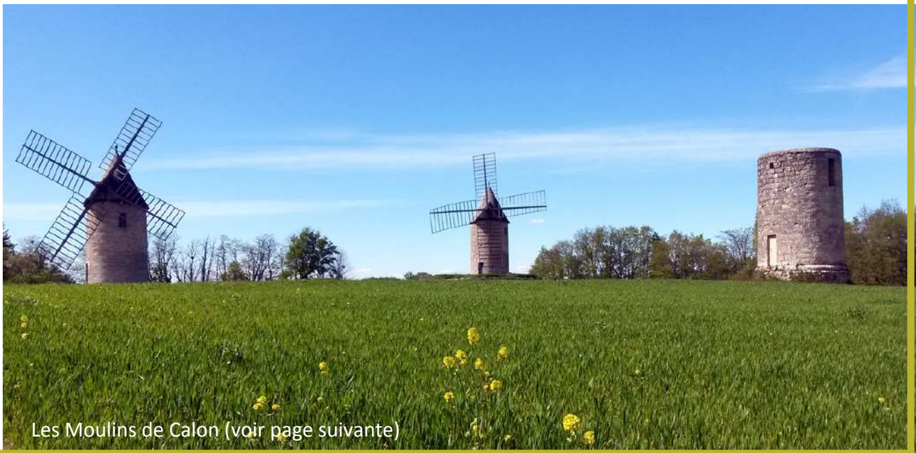
Les Moulins de Calon (voir page suivante)

Au rond-point de Saint-Émilion, prenez la D243 en direction de Saint-Christophe des Bardes et poursuivre sur 2,2km. Après le Château Badette, quitter la D243, tourner à gauche et longer les Châteaux Moulin de Lagnet (à gauche) et Laplagnotte-Bellevue (à droite). Après le petit pont en pierre enjambant la Barbanne, tourner à droite sur le chemin de Tuilerie de Cazelon et poursuivez sur 3,8km (chemin tuilerie puis Arvouet). Au carrefour (chemin Arvouet et Montagne), l'aire se trouvera en face, à droite.