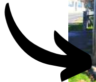
Le lavoir de Saint-Genès-de-Castillon