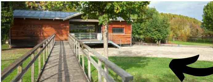
Le Jardin de la Lamproie