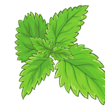
L'iris des marais