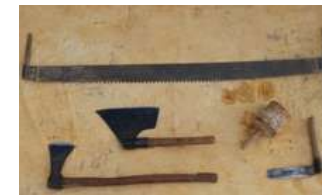
TAILLEUR DE PIERRE

7 Continue le long de la rue des Doutes. Il y a plus de 100 ans, des personnes vivaient dans des maisons souterraines. On peut voir des portes et des fenêtres murées au bout de cette rue. Ils cultivaient leurs potagers en face. Comment peut-on aussi appeler ce type de maison ? Réponse :